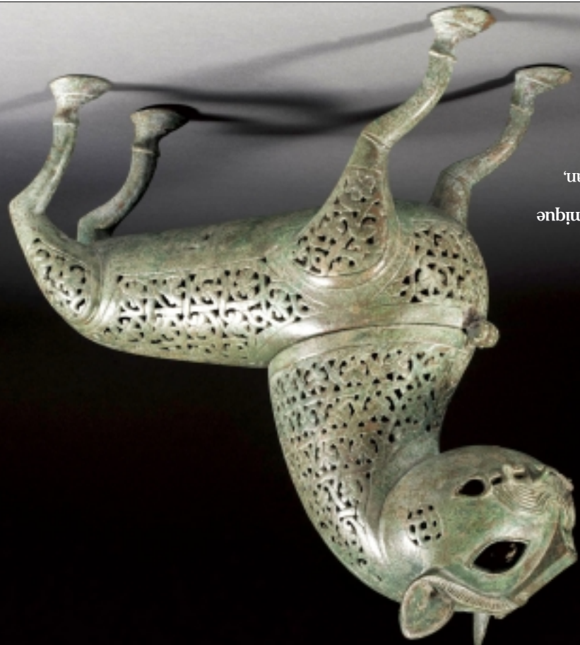
Brûle Parfums Islamique en forme de Lion Art Musulman, Iran, X ème s. ap. J.-C. (H: 27.0 cm, L: 27.0 cm)